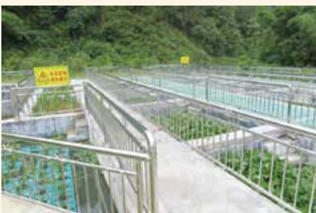
(3) 生態環境保護的污水處理廠