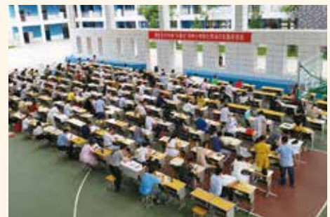
(1) 瑞金市舉辦的全市中小學書法比賽名為「樂善行杯」

註：本會舉辦的2019年「樂善盃」豬年慈善行山活動，已獲漁農自然護理署批許活動將於12月8日(星期日)在西貢傷健樂園舉辦。請大家繼續支持「樂善盃」慈善行山活動。謝謝！