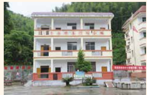
(8) 在贛州市崇義縣樂洞小學援建一幢三層高的教學綜合大樓