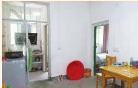
(2) 設備齊全的老師宿舍