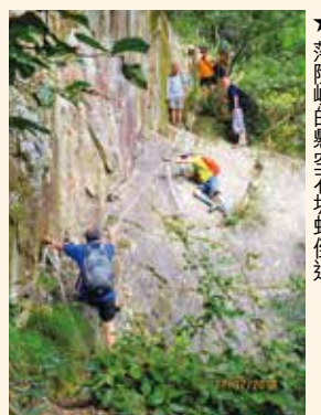
★落險峻的懸空石坡蛇倒退