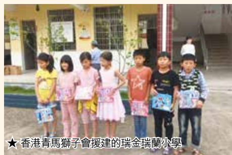
★香港青馬獅子會援建的瑞金瑞蘭小學