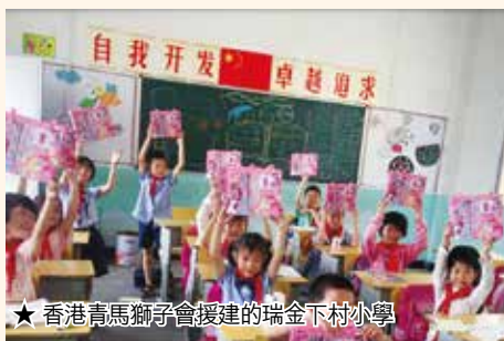
★香港青馬獅子會援建的瑞金下村小學