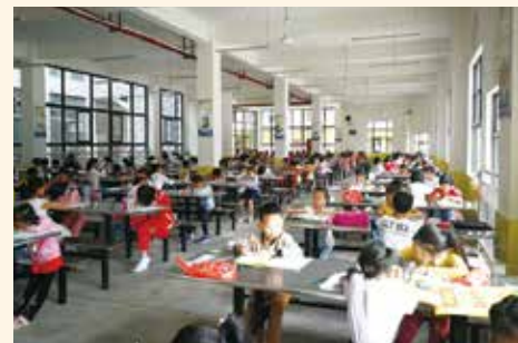
(3) 小學生參與書法比賽