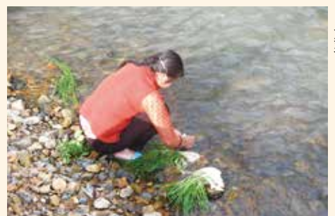
(5) 參觀之時河邊正好有位大嬸正在洗菜