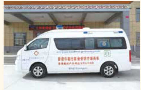
(5) 在青海省澤庫縣人民醫院捐贈的流動醫療車