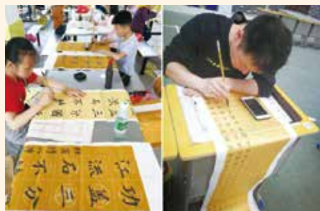
(4) 中華傳統文化，書法比賽