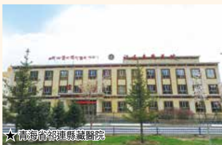
★青海省祁連縣藏醫院