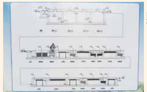
(2) 大家參觀污水環保處理工程的圖解