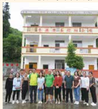
(1) 毅成戶外用品 在樂洞小學援建的三層高教學綜合大樓

也許是各界善心善舉感動天地，預報當日有雨，一直到我們的行程結束都是舒爽氣候，真的幸獲上天的眷顧。樂洞小學的孩子們沐浴在社會各界的關愛之中，定能奮發圖強，茁壯成長，將來回饋恩澤，報效社會！