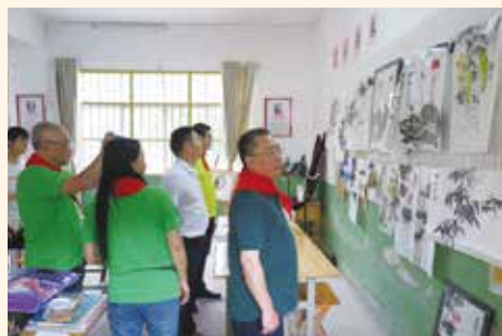
(2) 教學綜合大樓內設有圖書室