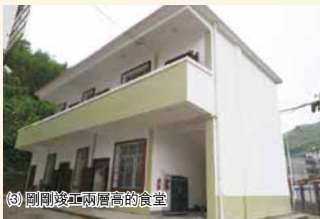
(3) 剛剛竣工兩層高的食堂