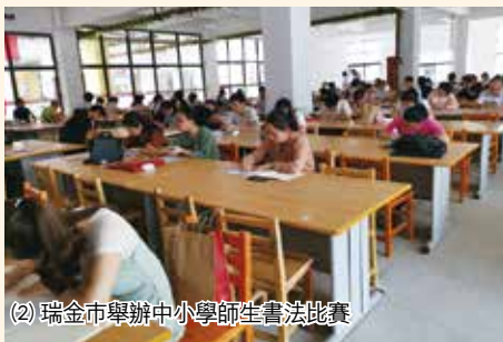
(2) 瑞金市舉辦中小學師生書法比賽