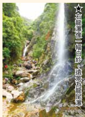
★右龍瀑像一幅白紗，遠景為龍尾瀑