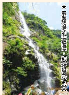
★氣勢磅礴的左龍瀑，疑是銀河落九天