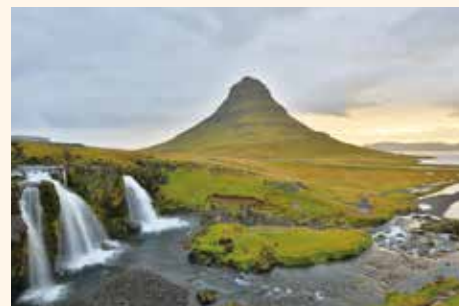
(3) 帽子山瀑布，瀑布群與帽子山相映成趣。