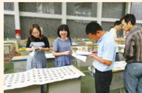
(6) 書法家任評審委員