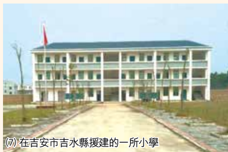
(7) 在吉安市吉水縣援建的一所小學