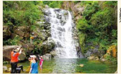
★黃龍石澗的標誌——黃龍瀑及黃龍潭

轉攀右龍石澗，可在右龍瀑的右側，接碎石小徑，登右龍瀑的壁頂，有一處垂直峭壁，雖有遊人綁上繩索，亦甚具危姿！瀑頂面對懸壁棧道，亦是唯一可賞左龍瀑全貌之處。不過，瀑頂之上的澗途，瀑壁都是中小型，旅人較喜愛黃龍石澗，遂關小徑接龍尾瀑頂，可攀黃龍上源、或左支源龍嘍石澗、或落蛇倒退及懸壁棧道，回接龍尾瀑附近折返東涌。右龍瀑稍前的澗途，六年前已叢莽茂密，難以前進！龍尾瀑頂亦有秀瀑，回望右龍瀑，又有不同景觀！這時若續攀黃龍或龍嘍，全程要七小時以上，可選擇落蛇倒退及懸壁棧道，回接龍尾瀑底，折返東涌，全程約六小時。不過，右龍絕壁和黃龍兩險並非人人適合，必須有徒手攀懸崖峭壁的技術和經驗，跟隨有經驗的旅行隊始可攀遊！參考地圖：郊區地圖《大嶼山》。