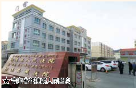
★青海省祁連縣人民醫院

青海省祁連縣人民醫院和祁連縣藏醫院，為慶祝5.12國際護士節，除一起進行暨健康巡迴義診服務活動外，為更好提高全體護理人員的文明禮儀素質，及弘揚南丁格爾精神，醫院舉辦多項活動，提升護士聖潔美好的職業形象，及護理技術操作比賽活動等，並為優秀的醫護人員送上紀念品及獎狀，以示獎勵。