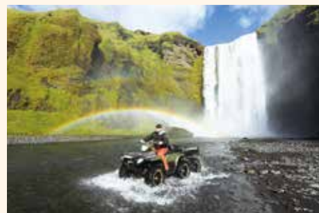
(1) 在著名的史高加瀑布 Skogafoss，巧遇有人正駕駛水陸車穿過彩虹。

然而，冰島馬因此對外來病毒完全沒有抵抗力，所以冰島法律嚴禁任何外來馬匹進口，島上馬匹一旦離境則永不允許再返回，國外使用過的馬鞍馬具俱不准進口。這一切，都保證了冰島馬的純粹和獨特性。冰島馬有一種與生俱來的步法 (tolt)，是其它馬種所沒有的，牠們快跑起來動作柔順、落地輕巧有如閒庭信步，人騎在馬上完全不覺得顛簸。這樣的奔跑絕技，使冰島馬成為全球愛馬者的寵兒，身價自然不菲。