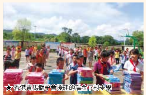
★香港青馬獅子會援建的瑞金下村小學