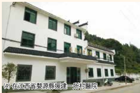
(4) 在江西省婺源縣援建一所村醫院