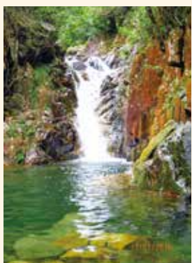
★龍瀑之上，有一個更艷麗的潭瀑