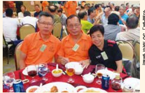
★本會成員應邀出席「香港業餘電台聯會」90週年會慶