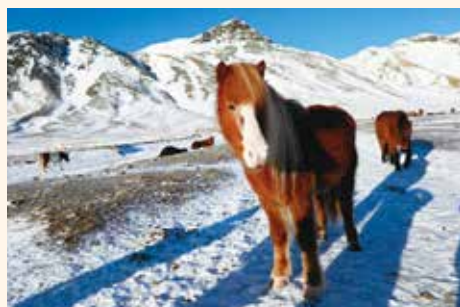
(4) 冰島馬是世界上獨特的馬匹種類