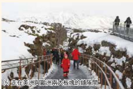
(5) 走在美洲與歐洲兩大板塊的縫隙間