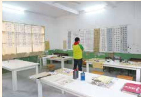
(5) 中華傳統文化的書法室