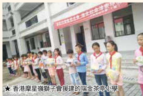
★香港摩星嶺獅子會援建的瑞金茶亭小學