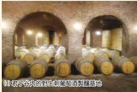
(3) 君子谷內的野生刺葡萄酒製釀基地