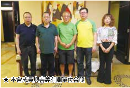
★本會成員與崇義有關單位合照