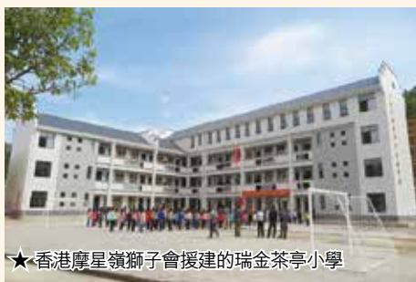
★香港摩星嶺獅子會援建的瑞金茶亭小學