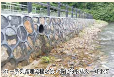
(4) 一系列處理流程之後，淨化的水排入一條小河