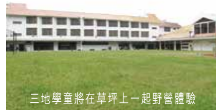
三地學童將在草坪上一起野營體驗

8月8-13日六天行程：海洋公園、太平山頂、淺水灣、夏令營、看電影、維港景色、科學館、太空館和參觀香港大學等等。