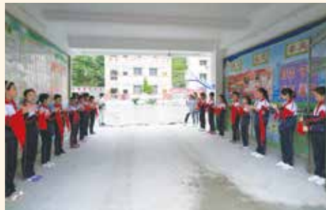
(1) 同學們早已穿著整齊的校服列隊在校門兩旁歡迎嘉賓們到訪

綜合樓就成為了同學們在課堂以外培養興趣愛好，促進身心發展，快樂無比的天堂，如此豐富多彩的興趣班活動，實在是讓我們覺得很驚訝很驚喜。我也明白了，樂洞小學的小學生，不管以後同學們在哪裏學習，哪裏工作，會走到哪個角落。充滿愛心與希望的“碑記”永遠都嵌入在孩子們的心裏。相信在愛心的扶助下，樂洞小學會越來越好，孩子的心中也將懷揣著感恩的赤子之心，茁壯健康的成長。