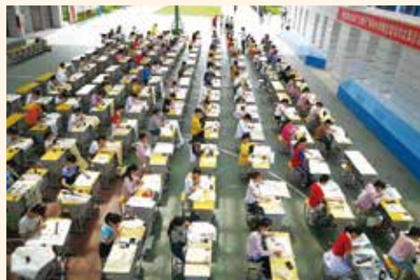
(1) 瑞金市舉辦的書法比賽活動熱火朝天進行中

2019年5月25日，「毅成戶外用品」透過「樂善行」在瑞金市舉辦的書法比賽名為「樂善行杯」，現場千多名中小學生參加比賽並圓滿結束。瑞金市舉辦的書法比賽歷年都得到「毅成戶外用品」贊助獎杯和禮品外，近這兩年書法比賽的首名可獲「毅成戶外用品」贊助到香港參與夏令營交流活動。