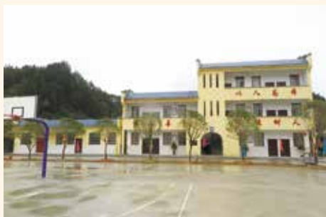
(6) 在吉安市遂川縣援建一幢老師宿舍並附有食堂