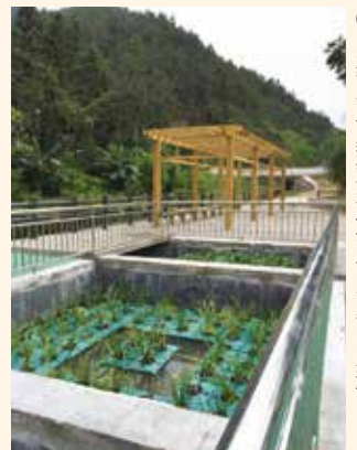
(1) 崇義縣政府對環境保護依然是毫不鬆懈

崇義縣一方面放棄了能夠快速促進經濟發展的工業致富之路，另一方面又要投入對已經產生污染的水，及環境進行治理。這樣計劃立項卻因為工程款短缺，而遲遲不能落實的村莊比比皆是。環保意識的社會具有重大意義，是造福百姓，利在千秋的大好事情，希望可以得到社會各界及善心人士的關注和捐助，讓我們的地球可以越來越美好！