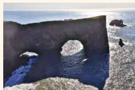
(6) 冰島南端的景點 Dyrholaey 斷崖，如天然石拱橋探入海中