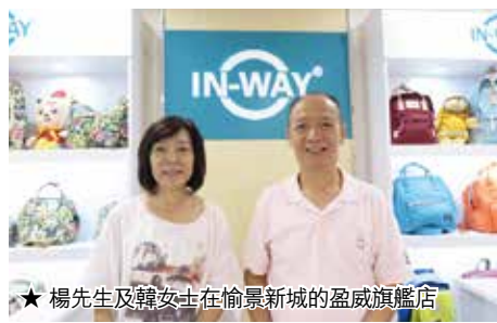
★ 楊先生及韓女士在愉景新城的盈威旗艦店