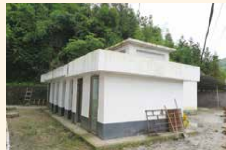
(4) 浴室緊貼著廚房而建的一棟磚混小房，內有兩個淋浴間