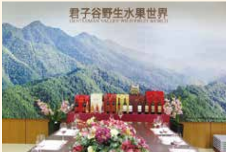
(2) 君子谷野生水果世界