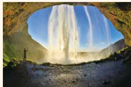
(2) 水簾洞瀑布從天而降的飛流，看洞外的落日景色，感覺奇幻極了。