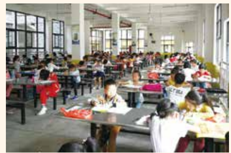
(2) 全瑞金市的小學生參加書法比賽